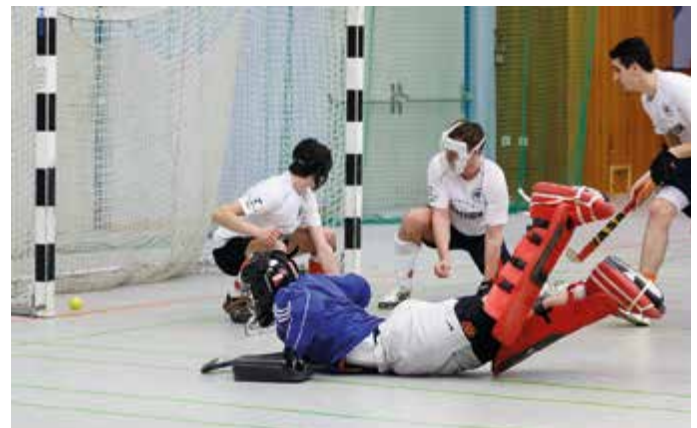
Das entscheidende Tor zum 5:2-Sieg).

Gegen Bayreuth bringt eine Strafecke die Entscheidung für den TSV Schwaben. In der Oberliga warten große Gegner. Doch das Erfolgsteam droht auseinanderzubrechen.