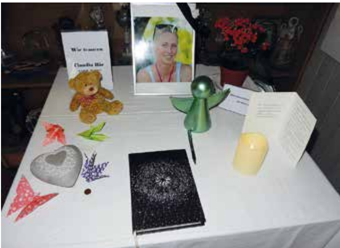
Kondolenzbuch im Bootshaus Kanu Schwaben

Ihr sportliches Können und die Erfahrung investierte sie zusammen mit Sideris mit großer Begeisterung in die Jugendarbeit. Ihre ganz besondere Eigenschaft war jedoch die Unbefangenheit und