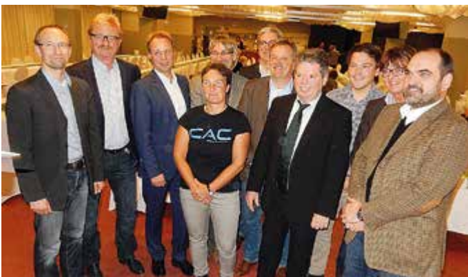
Der neue Sportbeirat